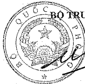
Đại tướng Ngô Xuân Lịch