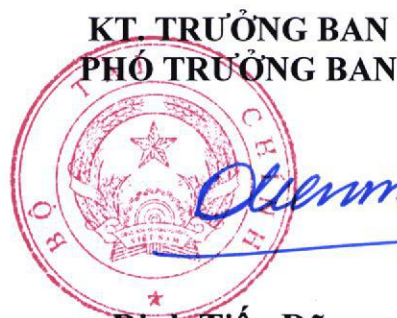
Đình Tiến Dũng Bộ trưởng Bộ Tài chính