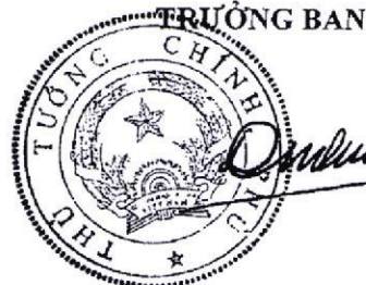
PHÓ THỦ TƯỚNG Vương Đình Huệ